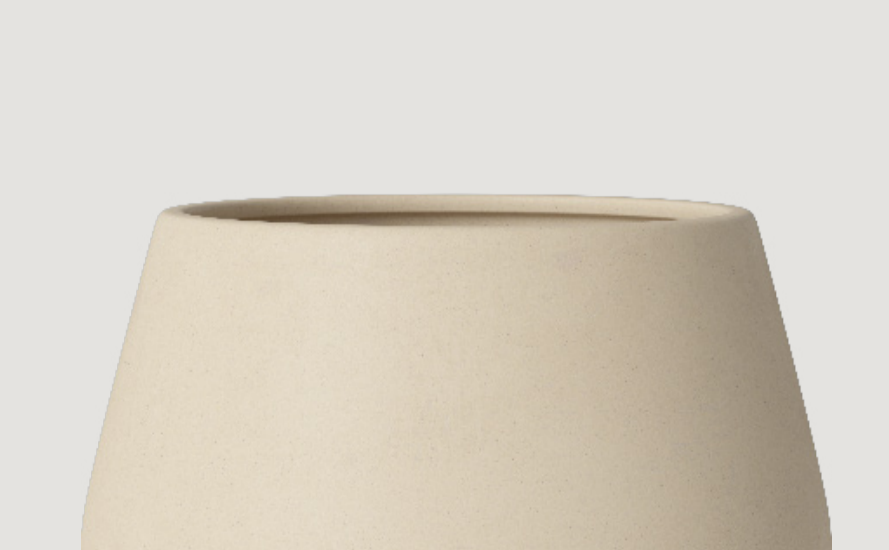
Calm Puf Designet af Ferriani Sbolgi