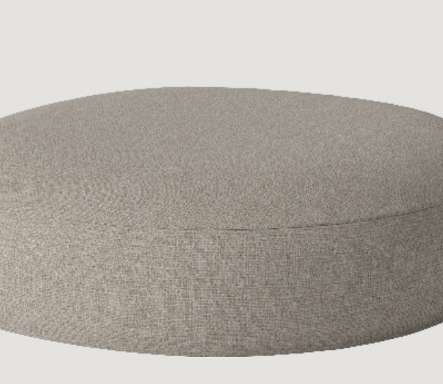
Drum Havebord Designet af Kaschkasch

Ud over disse højdepunkter omfatter Bolias udendørskollektion ligeledes en række andre designs, herunder sofaer, sofaborde, tæpper, urtepotter og dekorativt tilbehør.