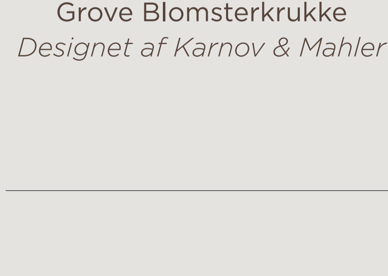
Grove Blomsterkrukke Designet af Karnov & Mahler